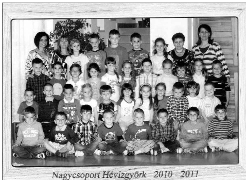
Nagycsoport Hévízgyörk 2010 - 2011

Ezekre az eseményekre nagy örömmel, kitartással és fegyelemmel készültek gyermekeink, ami előadásainkon aztán meghozta gyümölcsét. Minden rendezvényen becsülettel helytálltak a nagycsoportosok.